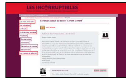
Espace de discussion