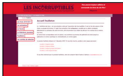
Page d'accueil du Feuilleton

✓ Au terme du Feuilleton, le livre sera publié sous format numérique. Sous réserve de contraintes techniques, le texte pourra même être édité sous format papier pour se retrouver alors, sur les tables des librairies !