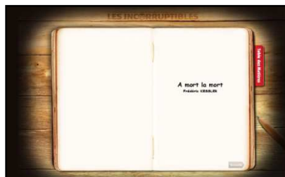
Livre de l'auteur